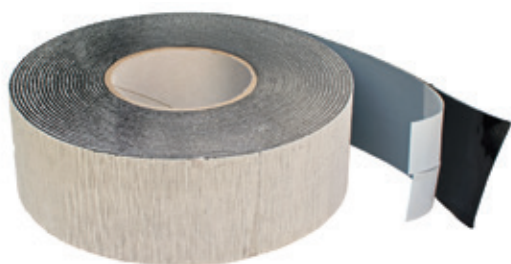
Lengte: 10 m Breedte: 60 mm